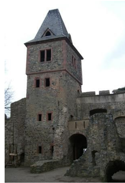
auf der Burg Frankenstein

Veranstaltet von Freie evangelische Gemeinde Seeheim-Jugenheim Am Bahnhof 1 64342 Seeheim-Jugenheim www.fegsj.de Gottesdienste immer sonntags 10 Uhr (auch auf Youtube.de)